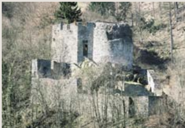
Ruine Unspunnen, Ansicht von Norden.