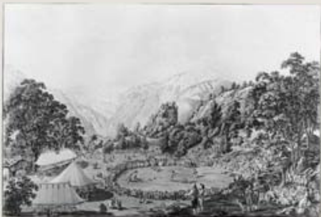
Das Alpherntes von 1805 vor der Ruine Unspunnen in zeitgenössischer Darstellung.

Restaurierungen 1946/47 (Kur- und Verkehrsverein Wilderswil mit Internierten), 1968/69 (Christian Frutiger) sowie 1988–90 (Hochbauamt/Archäologischer Dienst des Kantons Bern). Die Anlage ist Eigentum des Kantons Bern.