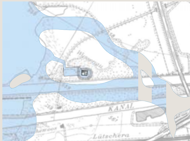
Ruine Weissenau. Situationsplan mit alten Wasserläufen.

Pläne zum Ausbau 1655 und um 1700 scheiterten. Um 1893 Bau des Schiffahrtskanals und Aarekorrektur; seither ist die Weissenau mit dem Festland verbunden. 1954/55 Freilegung und Sicherung der Ruine durch Christian Frutiger, 1957 Sondiergrabungen, 1988/89 Konservierung durch Hochbauamt