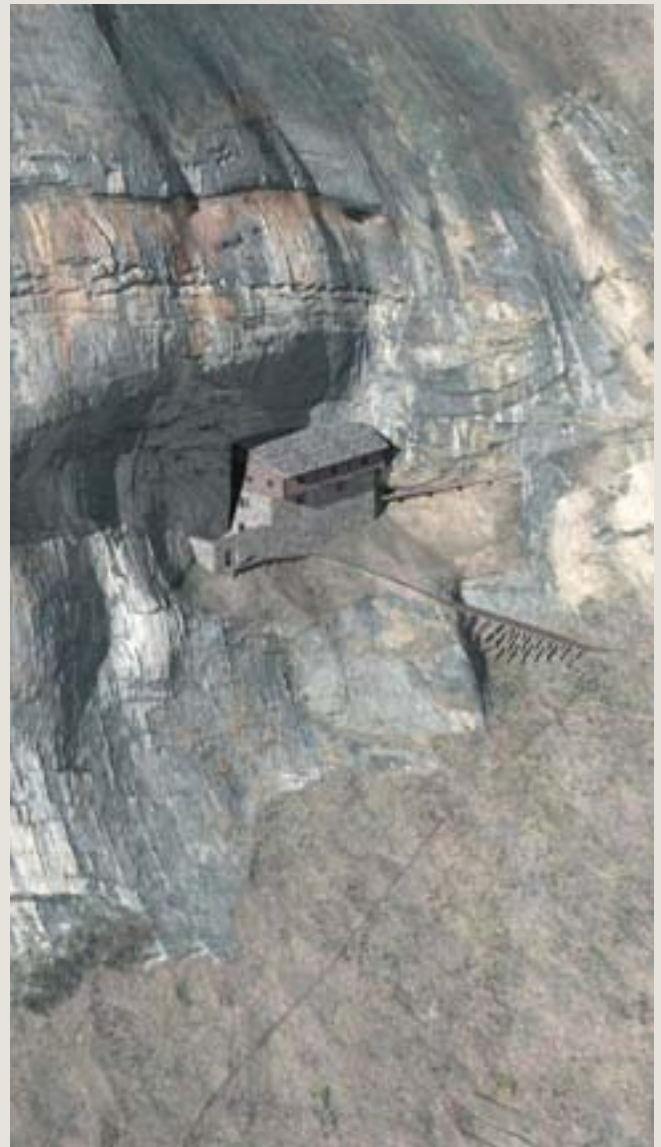
Ruine Rothенfluh. Rekonstruktion der Burganlage im Zustand des 13. Jahrhunderts. Blick nach Westen.