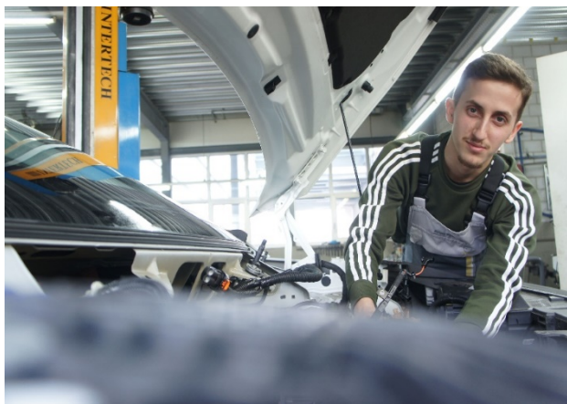
Un élève dans son entreprise formatrice

En 2020, nous avons enregistré un recul net du nombre d'élèves pour le préapprentissage et l'année scolaire de préparation professionnelle Pratique et intégration (API). La chute de la demande pour ces offres, destinées aux personnes issues de l'immigration, est entre autres à mettre sur le compte de la baisse du nombre de demandes d'asile. 2