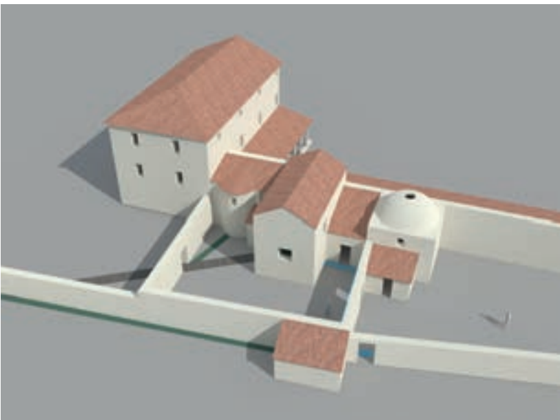
Abb. 8: Port, Bellevue. Rekonstruktion der Aussenansicht. Blick nach Nordosten.