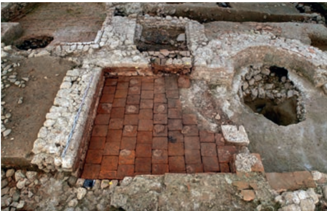
Abb. 10: Port, Bellevue. Detail des Plattenbodens im caldarium mit den Pfeilerabdrücken. Im Hintergrund das praefurnium und rechts beim Steinraubloch der Ausbruch unter der Apsis mit dem Entwässerungskanal. Blick nach Westen.

Abb. 9: Port, Bellevue. Rechteckiger Raum mit Apsis ( tepidarium ). Im Vordergrund liegen einige pilae noch auf dem Mörtelboden, in der Apsis ist ein Steinraubloch zu sehen. Im Hintergrund ( caldarium ) liegt hinter Tuffpfeilern ein Plattenboden. Blick nach Süden.