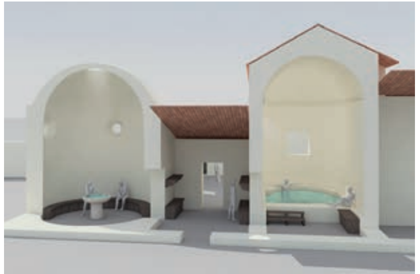
Abb. 4: Port, Bellevue. Rekonstruktion der Innenansicht. Blick nach Westen.

Zwischen der Umfassungsmauer und der Badeanlage konnte ein Hof abgegrenzt werden (Abb. 2). Zwei Mauern, die rechtwinklig an die im Westen gelegene Umfassungsmauer stiessen,