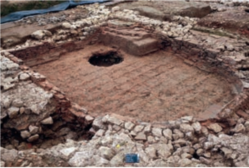
Abb. 7: Port, Bellevue. Die piscina mit abgestuftem Sockel zum Einstieg. Neben dem Sockel ist das Steinraubloch von der Plünderungsaktivität gut zu erkennen. Im Vordergrund links sieht man die runde Aussparung in der Mauer, durch die das Wasser des Beckens abfloss. Blick nach Südosten.