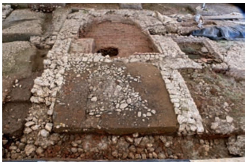
Abb. 6: Port, Bellevue. Frigidarium : der Umkleideraum mit erhaltener Bodenrollierung im Vordergrund und das Wasserbecken im Hintergrund. Blick nach Westen.