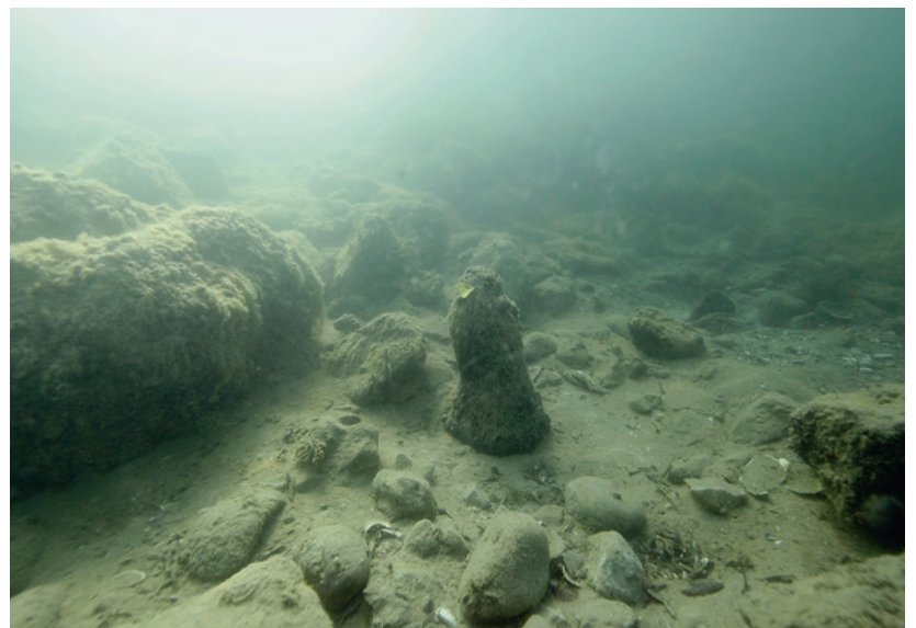
Abb. 3: Ipsach, Erlewäldli. Erodierter Eichenpfahl vor dem nordöstlichen Blockwurf.

Von insgesamt 16 über das gesamte Areal verteilt entnommenen Dendroproben weisen alle acht Eichenpfähle mit Waldkante Schlagdaten aus den Jahren 3007/3006 v. Chr. auf. Sie bestätigen das bereits anhand des Pfahlplans gewonnene Bild einer einphasigen Siedlung. Am Bielersee findet sich eine zeitgleiche Schlagphase bei einer Struktur unbekannter Funktion an der Fundstelle Nidau, BKW. Ähnliche Zeiträume belegen Fälldaten aus den Pfahlbausiedlungen von Twann, Bahnhof, Sutz-Lattrigen, Hauptstation und La Neuveville, Schafis/Chavannes.