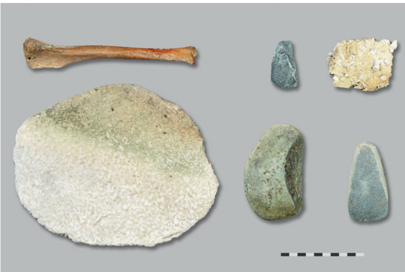
Abb. 5: Ipsach, Erlewäldli. Anlässlich der Bestandsaufnahme kam nur eine Handvoll Funde zum Vorschein.

umfasst wenig lithisches Material, darunter zwei Steinbeile, einzelne Wandscherben sowie Knochen (Abb. 5). Aufgrund ihrer groben Machart lässt sich die Keramik problemlos mit einem horgenzeitlichen Fundkomplex in Verbindung bringen.