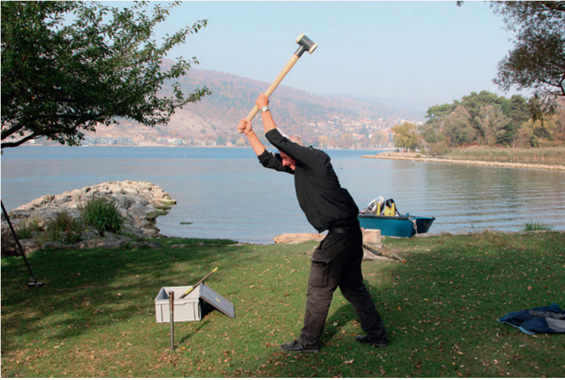
Abb. 4: Ipsach, Erlewäldli. Einschlagen des Bohrgerüstes zur Abklärung der Schichterhaltung.

Was sich schon bei der Oberflächenaufnahme abgezeichnet hatte, wurde durch die Kernbohrungen bestätigt (Abb. 2a und 4): Archäologische Schichten sind nicht mehr vorhanden, weder see- noch landseitig. Der aktuelle Seegrund im Bereich des Pfahlfeldes liegt zwischen 426,4 und 427,5 m ü. M. Die durchschnittliche Kulturschichthöhe der meisten Seeufersiedlungen um den Bielersee befindet sich auf 427,5 bis 428,5 m ü. M. Es ist folglich davon auszugehen, dass die organischen Siedlungsreste ursprünglich ein gutes Stück höher lagen.