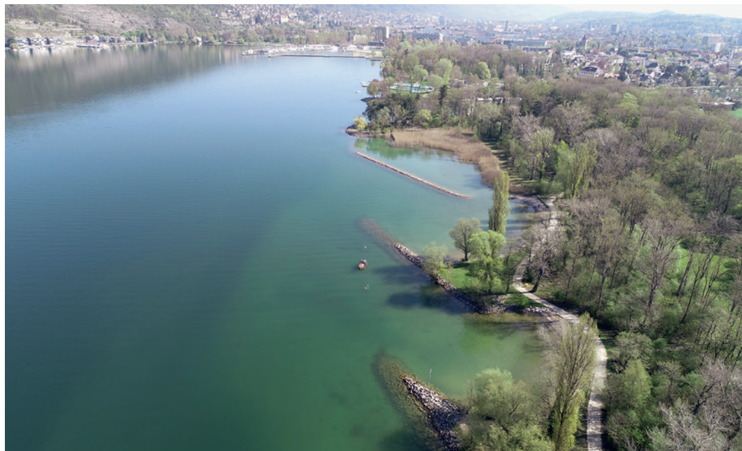
Abb. 1: Ipsach, Erlewäldli. Der Seeuferbereich, an dem bei Tauchuntersuchungen eine neolithische Fundstelle entdeckt wurde. Im Hintergrund gegen Norden das untere Seebecken mit den Städten Biel und Nidau.

Die Wassertiefe am Fusse des Blockwurfs beträgt rund 2 m (bei einem durchschnittlichen Sommerwasserstand von 429,5 m ü. M.). Richtung Seehalde sinkt die schmale Strandplatte kontinuierlich ab. Die Oberflächensedimente bestehen aus einer nur wenige Zentimeter mächtigen, sandig-schlickigen Deckschicht. Darunter folgt ein scharfer Wechsel zu gefestigten limnischen, zum Teil seekreideartigen Ablagerungen.