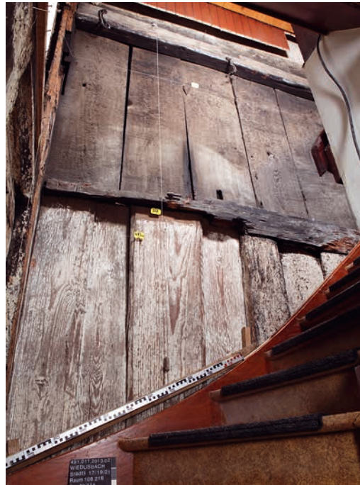
Abb. 7: Wiedlisbach, Städtli 19. Bohlenwand im ersten und zweiten Obergeschoss. Im Spätmittelalter war die Wand zwischen dem Wohnbau und dem zugehörigen Tenn eingebaut worden.

Im Gebäude Städtli 21, das seit etwa 1540 in den Quellen als «Bürger- und Rathaus» fassbar ist, lassen sich im ausgehenden 17. Jahrhundert weitere Umbaumaassnahmen feststellen. Auf der Gassenseite wurde damals das Dach angehoben (Abb. 6, grün). Auch die jetzige Fenstergliederung der Fassade stammt aus dieser Zeit. Raumeinteilungen im zweiten Obergeschoss und der Einbau einer fischgratförmig verlegten Schiebbodendecke im ersten Obergeschoss deuten auf eine umfassende Modernisierung auch im Inneren hin. Ein Dendrodatum der Decke weist in die Zeit um 1690. Weitere Anpassungen am Gebäude erfolgten im 18. und 19. Jahrhundert. Die auffälligste Massnahme wurde 1739 realisiert, als gassenseitig der heutige Quergiebel (Abb. 6, orange) eingebaut wurde. Dadurch sollte das neu montierte Uhrwerk zur Geltung gebracht werden. Der Neubau verursachte im Dachwerk allerdings erheblichen Schaden an der Statik. Anpassungen der Deckenhöhen und der Raumgliederungen des Gebäudes verschärften die prekäre Bausituation im Bereich des Dachreiters weiter. Im 19. Jahrhundert musste deshalb eine massive Unterfangung (Abb. 6, dunkelblau) eingebaut werden. Insbesondere im Erdgeschoss folgten im 20. Jahrhundert weitere Anpassungs- und Modernisierungsmassnahmen