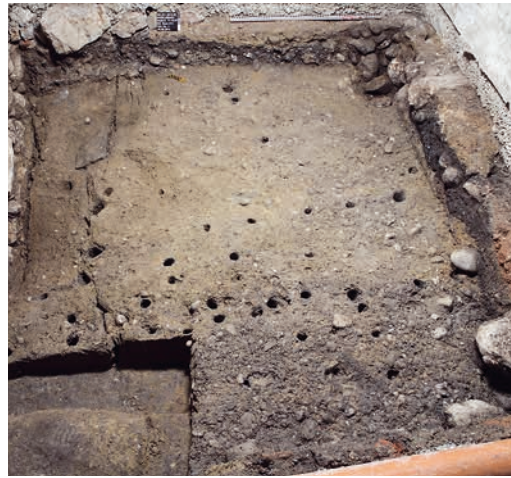
Abb. 3: Wiedlisbach, Städtli 21. Stadtgründungshorizont mit der ersten Kiesplanierung auf dem anstehenden Boden, darin die Löcher der Stickelreihe einer möglichen ersten Parzellengliederung.

Neben den Fachwerk- und Pfostengebäuden aus Holz bestanden wahrscheinlich von Beginn an auch erste Steinhäuser. Eines davon hat sich in der Brandwand zwischen den Parzellen 19 und 21 erhalten. Ausserdem zeichnen sich dort die Balkenspuren (Abb. 5, rosa) einer gassenseitigen Stube oder Kammer ab, die mit einem Holztäfer ausgeschlagen war. Deutliche