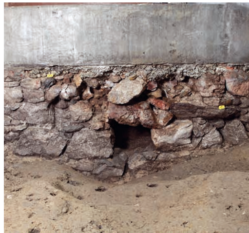
Abb. 4: Wiedlisbach, Städtli 21. Entwässerungskanal in der Stadtmauer des 13. Jahrhunderts auf Höhe des Stadtgründungshorizontes.