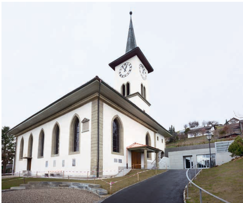
Abb. 1: Grosshöchstetten, Kirche und Friedhof. Die 1811 errichtete Kirche mit dem neuen Nebengebäude von 2015. Blick nach Nordosten.