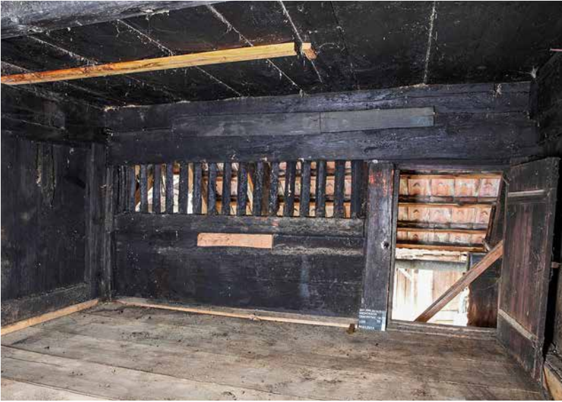
Abb. 3: Wichtrach, Oberdorfstrasse 18/20. Gadenbereich der ehemals offenen Rauchküche mit Vergitterung des Rauchabzugs im westlichen Hausteil. Blick nach Nordwesten.

auf der gegenüberliegenden Giebelseite konstruiert ist. Er grenzt mit seinem Ostgiebel an einen mit einer Mauer eingefassten kleinen Innenhof, der heute modern überbaut ist. Ursprünglich gehörte zum Innenhof wahrscheinlich ein kleiner Ökonomietrakt. Da der Hausteil noch bewohnt ist, konnte die Konstruktion nur von aussen untersucht und dokumentiert werden. Dies ist allerdings zu verschmerzen, da das Stubengeschoss und das kniestockhohe Gadengeschoss stark modern überprägt und verändert sind. Auf der Giebelseite ist die ursprüngliche Situation noch gut ablesbar (Abb. 4). Auch dort bestand eine Laube, die Zugang zum Gaden gewährte. Das Dach war nicht wie heute als reines Satteldach gestaltet, sondern bildete einen