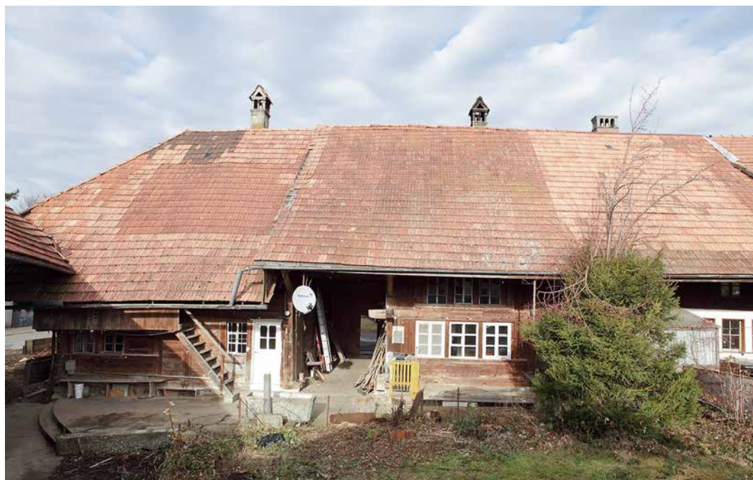
Abb. 1: Wichtrach, Oberdorfstrasse 18/20. Das Mehrfach-Taunerhaus von der Südseite. Das nachträglich angehobene Dach der östlichen Hausteile bringt die Uneinheitlichkeit des Gebäudes zum Ausdruck.

Der westliche, zur Gasse gerichtete Hausteil wurde offenbar in einem Zuge über einem