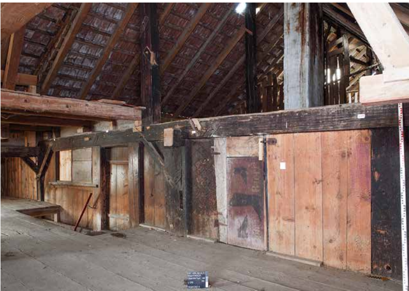
Abb. 4: Wichtrach, Oberdorfstrasse 18/20. Giebelansicht des östlichen Hausteils auf Höhe des Gadengeschosses. Blick nach Nordwesten.

Walm aus, der über die Laube reichte. Wenn gleich heute zahlreiche Streben herausgesägt sind und fehlen, ist die ursprüngliche Zimmerung mit sauber gefügten Verblattungen an Ständern und Rähmbalken noch zu erkennen. Die hohe Qualität der Arbeit unterscheidet wiederum diesen Hausteil von jenem auf der Gassenseite, der deutlich weniger aufwendig abgezimmert ist. Offenbar spiegelt sich darin die Handschrift zweier unterschiedlicher Zimmermeister wider. Unterstützt wird diese Vermutung durch die vorliegenden Dendrodaten, die für den östlichen Hausteil in das Jahr 1739 weisen.