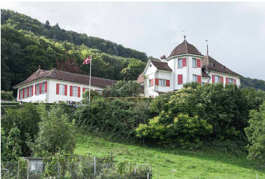
Abb. 1: Toffen, Schloss. Ansicht von Südosten.

Die bekannten Ansichten stammen von Albrecht Kauw, der um 1670 im Auftrag des damaligen Schlossherrn die Anlage von der Berg- und von der Talseite in bekannt zuverlässiger Manier porträtierte (Abb. 2). Die imposante Talansicht wird dominiert von einem viergeschossigen Höchhus mit hoch aufragendem