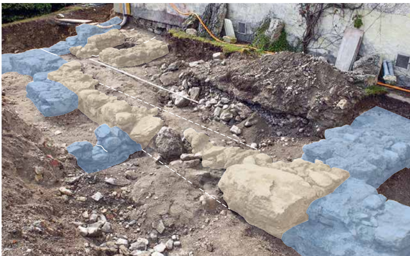
Abb. 3: Toffen, Schloss. Untersuchungsbereich nördlich des heutigen Schlosses mit Mauerresten der Vorgängerbauten (braun) und des Höchhus (blau). Blick nach Südosten.

Walmdach, ein für die Zeit des 16. Jahrhunderts charakteristischer herrschaftlicher Bau (blau). In Steffisburg ist ein vergleichbares Gebäude bis heute erhalten geblieben. Vorangestellt ist dem Hauptgebäude ein von einer mächtigen Brüstungsmauer und einem halbrunden Turm (grün) eingefasster schmaler, zwingerartiger Hof. An der Südostecke sind dem Höchhus ein kleiner Zwischentrakt (blau) und ein zum Tal hin vorspringender polygonaler Treppenturm angefügt (rot). Im Süden schliesst eine dreiflügelige Hofanlage die Baugruppe ab (gelb). Ecktürme und ein Zinnenkranz verleihen den Schlossbauten ein wehrhaftes Aussehen, das dem gesellschaftlichen Selbstverständnis des Bauherrn Rechnung trägt, vermutlich ohne dass die Anlage noch von militärischem Nutzen war. Südlich vorgelagert ist der Baugruppe eine langgestreckte, von einer hohen Mauer eingefasste