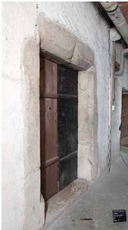
Abb. 4: Ligerz, Chlyne Twann 7. Erdgeschoss. Der westseitige Kellerzugang. Das Türgewände besteht aus Jurakalkstein, der Türsturz ist mit einem Eselsrücken hervorgehoben. Die seitlich heruntergezogene Fasse endet jeweils in einem schrägen Abwurf. Blick nach Osten.

grosszügig bemessene Raum konnte während der Weinlese als Speisesaal der Arbeiterschaft und nach Abschluss der Ernte als Festsaal genutzt werden.