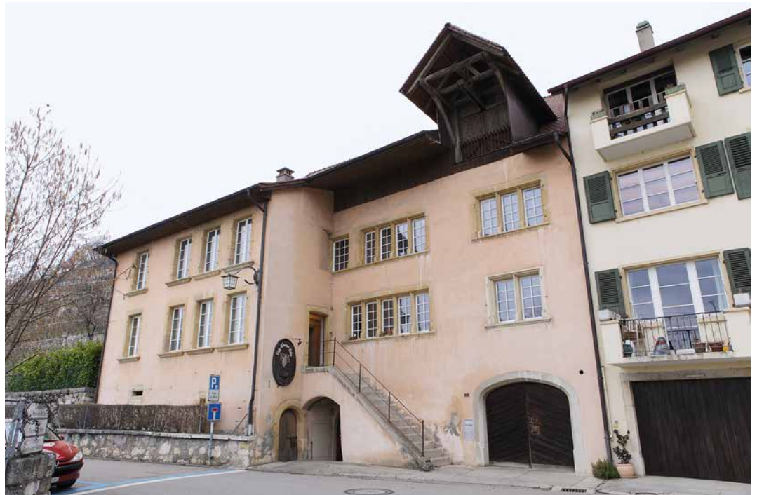
Abb. 1: Ligerz, Chlyne Twann 7. Südfassade. Das Haus wurde im Laufe der Zeit stetig erweitert. Deutlich stehen die nach Süden vorspringende Erweiterung und der nachträglich angebaute Hochengang ins Auge. Die jüngste Erweiterung nach Westen zeichnet sich durch die abgesetzten Fenster am linken Rand ab. Blick nach Nordwesten.

Das Haus setzt sich aus mehreren im Laufe der Zeit an- und umgebauten Gebäudeteilen zusammen (Abb. 1). Die Anfänge sind von bauarchäologischer Seite nicht sicher einzuschätzen. Der im Grundriss trapezförmige Kernbau könnte