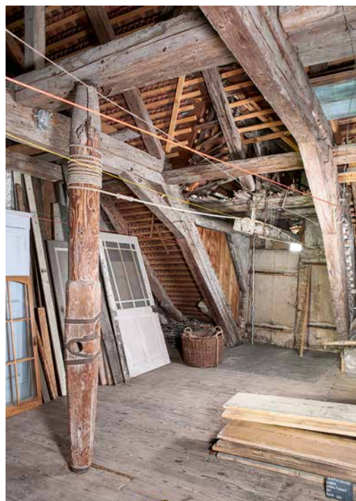
Abb. 3: Ligerz, Chlyne Twann 7. Dachgeschoss. Der Aufzugsgiebel wurde zusammen mit dem Dachstuhl gebaut. Links im Bild ist die originale Winde zu sehen, mit deren Hilfe die Lasten unters Dach befördert werden. Blick nach Südosten.

Das erste Obergeschoss wurde im östlichen Bereich zu Wohnzwecken genutzt. Auf der Strassenseite weisen aufwendig gearbeitete Reihfenster auf eine Stube und eine Kammer hin. Auf der Rückseite lag vermutlich die Küche. Der westliche Abschnitt unterscheidet sich davon deutlich. Hier ist ursprünglich ein ungeteilter Saal anzunehmen. Der mit etwa 40 m 2 Fläche