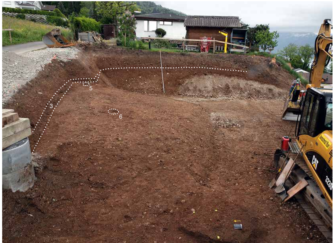
Abb. 2: Hilterfingen, Tannenbühlweg 4. Die Fundschicht 3 dehnte sich über die ganze Grabungsfläche aus. M. 1:500.

Abb. 1: Hilterfingen, Tannenbühlweg 4. Die Grabungsfläche nach dem Abbau der Fundschicht 3, die sich in den Profilen als dunkle Schicht erkennen lässt. Es zeichnen sich zwei Pfostengruben (5, 6) ab. Blick nach Osten.