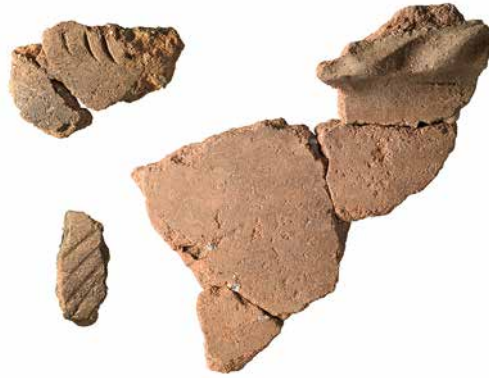
Abb. 3: Hilterfingen, Tannenbühlweg 4. Dekorationsvarianten an Gefässkeramik (Ind. 6, 17 und 18). M. 1:2.

Unter der Fundschiicht 3 zeichneten sich vor dem Nordprofil die beiden Pfostengruben 5 und 6 ab (Abb. 2). Ihre Durchmesser betragen 45 respektive 35 cm, ihr Abstand 4,5 m. Ob die Pfosten, die einst in diesen Gruben standen, eine Hauskonstruktion trugen, kann nicht belegt werden. Ihre Grösse und Abstände könnten dafür sprechen. Wahrscheinlich setzt sich die Konstruktion nach Norden bis unter den Tannenbühlweg fort und bleibt im Boden geschützt erhalten.