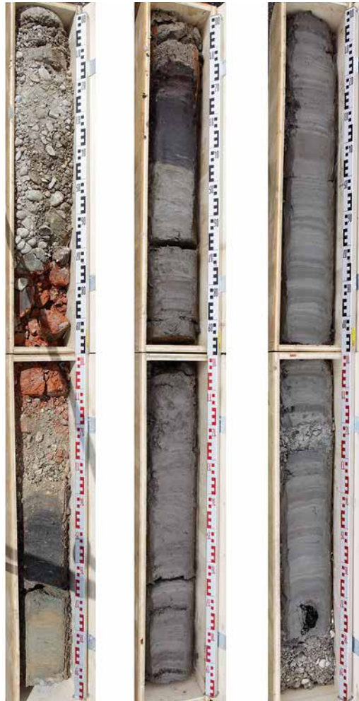
Abb. 1: Biel, Feldschlössliareal. Bohrkern 3037 mit der Schichtabfolge von der modernen Aufschüttung (links oben) bis in die Mittelsteinzeit (rechts unten).

Basierend auf den Ergebnissen der Bohrsondierungen wurden zusätzlich 12 Sondierschnitte mit dem Bagger angelegt. Die Schnitte erreichten eine Tiefe von bis zu 5,7 m. Damit wurde versucht, die Resultate der Bohrungen zu verifizieren.