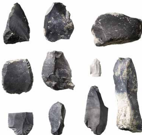
Abb. 6: Biel, Feldschlössli-areal. Scherbe eines cortailodzeitlichen Keramiktopfs aus Sondierschnitt 3104.