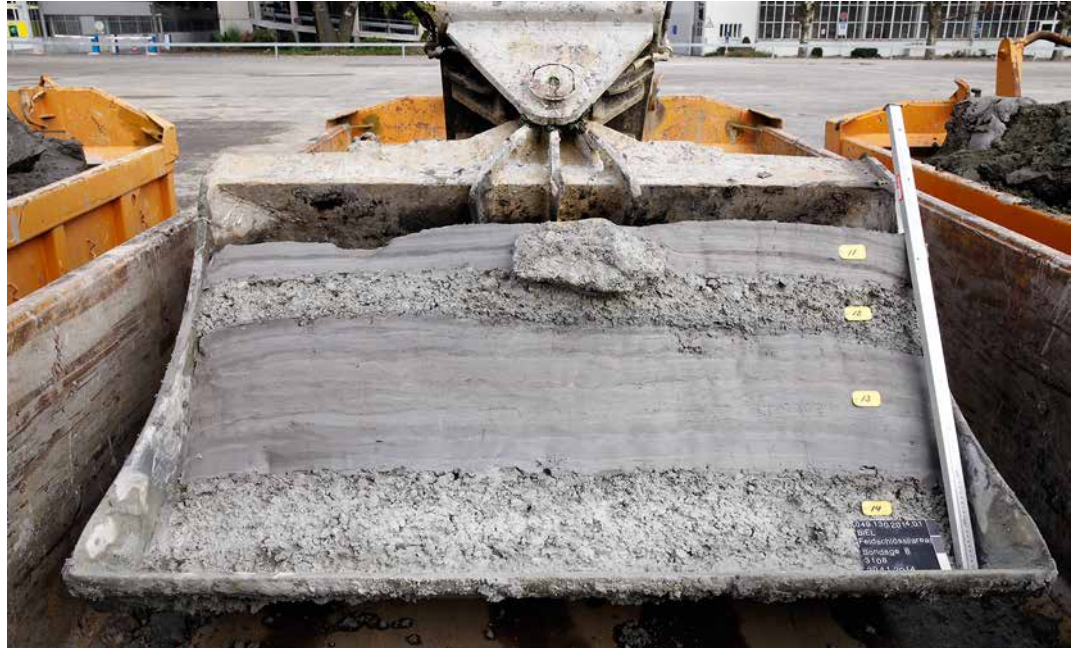
Abb. 4: Biel, Feldschlössli-areal. Baggerschaufel mit der archäologischen Fundschicht zwischen gebänderten Tonpaketen. Der grosse Bruchstein ist ein deutlicher Hinweis auf menschliche Aktivität.

noch in eingeschränktem Mass vorhanden. Alle stabileren Materialien wie Holz, Keramik, Knochen und Stein blieben aber erhalten. Wir sprechen in einem solchen Fall von einem Reduktionshorizont.