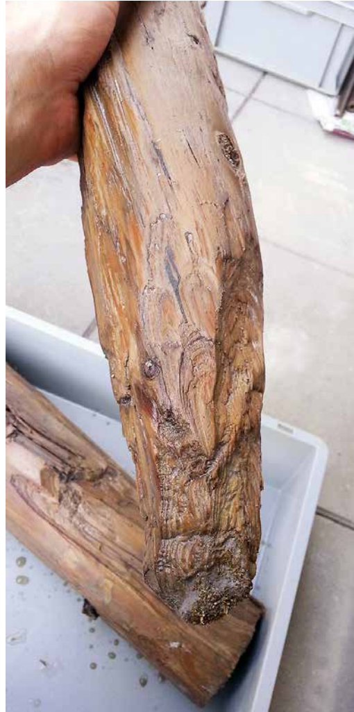
Abb. 7: Biel, Feldschlössliareal. Die Spitze eines 1,5m langen Pfahls ist mit dem Steinbeil bearbeitet.

Unter den neuzeitlichen Strukturen liegen in grosser Tiefe prähistorische Siedlungsreste. Sie belegen sehr schön, dass dieses Areal im 39. Jahrhundert v. Chr. und vermutlich weit darüber hinaus im Uferbereich des Sees lag. Eine archäologische Untersuchung der sondierten Flächen wird neue Erkenntnisse über die Zeit des frühen Cortaillods liefern.