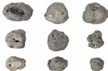
Abb. 3: Biel, Feldschlössliareal. Onkoiden aus der archäologischen Fundschicht. M. 1:2.