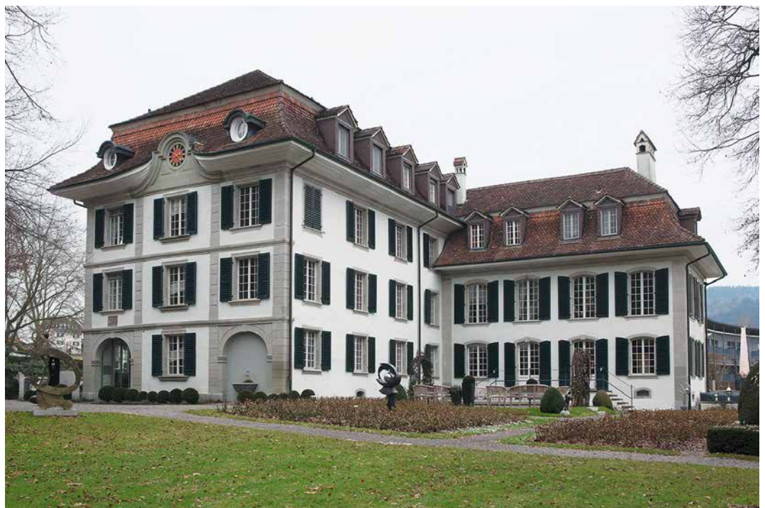
Abb. 1: Konolfingen, Schloss Hünigen. Südostansicht des Schlossbaus mit dem renaissancezeitlichen Treppenturm und dem Barockflügel.

2012 entschloss sich der neue Eigentümer von Schloss Hünigen dazu, das bestehende Hotel und Tagungszentrum zu modernisieren. Seit 1961 ist in Hünigen ein Schulungsort eingerichtet. Bereits 1976 und 1997/98 waren umfangreiche Umbauten erfolgt. Sie haben zu erheblichen Eingriffen in das national bedeutende Baudenkmal geführt. Der Wirtschaftskomplex mit der Mühle ist seitdem nahezu vollständig