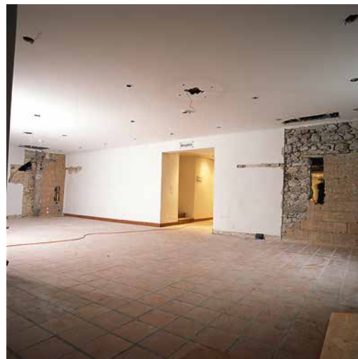
Abb. 3: Konolfingen, Schloss Hünigen. Sondierflächen auf der Nordseite des ältesten Kernbaus mit dem Gewölbekeller. Blick nach Süden.

Auskunft. Die enge Verbindung von Mühle und Herrnsitz ist seit dem Mittelalter häufig zu beobachten. Das Mahlen von Getreide gehörte ursprünglich zu den grundherrlichen Rechten, die an die jeweilige Herrschaft gebunden waren.