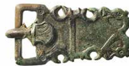
Abb. 5: Köniz, Niederwangen, Stegenweg 17. Grab 101 eines 11- bis 12-jährigen Kindes mit einer Gürtelschnalle aus Bronze im Beckenbereich. Blick nach Nordwesten.