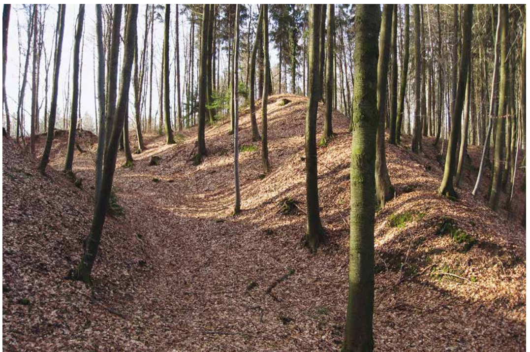
Abb. 1: Büren an der Aare, Ruine Strassberg. Mächtiger Ringgraben und Wall der Burganlage. Blick nach Süden.

Seit dem frühen 19. Jahrhundert fanden in der Burganlage wiederholt Ausgrabungen und Fundbergungen statt. Bis auf die Untersuchungen im Jahr 1949 sind diese eher als Raubgrabungen denn als systematische Ausgrabungen zu bezeichnen. Sämtliche Forschungen genügen in keiner Weise heutigen wissenschaftlichen Ansprüchen. Weithin bekannt geworden sind die zugehörigen reichen Fundinventare. Ein kleiner Teil davon wird heute im Ortsmuseum Büren und in den Historischen Museen von Basel und Bern verwahrt. Zahlreiche verzierte Bodenplatten aus Ton heben sich vom übrigen Bestand ab. Sie zeugen von der hochwertigen Ausstattung der adeligen Gemächer