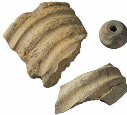
Abb. 4: Bern, Münsterergasse 18. Perlenförmiger Spinnwirtel aus Ton und Scherben von spätmittelalterlichen Ofenkacheln (13./14. Jahrhundert). M. 1:2.

mige Ofenkacheln ergänzen das Bild für die Zeit vor dem grossen Brand (Abb. 4). Die Kachelreste zeugen von einem gewissen Wohnkomfort der Bewohner an der Münsterergasse im 13. und 14. Jahrhundert.