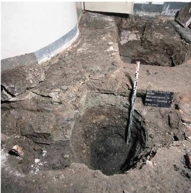
Abb. 1: Bern, Münstergasse 18. Innenhof mit den freigelegten Böden der frühen Neuzeit und den Leitungsbaugruben. Blick nach Westen.

der Frühen Neuzeit bis ins 19. Jahrhundert. Ein dort eingerichteter hölzerner Schuppen könnte von einem Handwerker genutzt worden sein. Nur in den Leitungsgruben für die neue Anbindung der Haus- und Dachentwässerung an den Ehgraben wurde weiter in die Tiefe untersucht. Die beiden dokumentierten Profile erzählen eindrücklich von der wechselvollen Geschichte vor Ort seit der Stadtgründung um 1200 (Abb. 2 und 3).