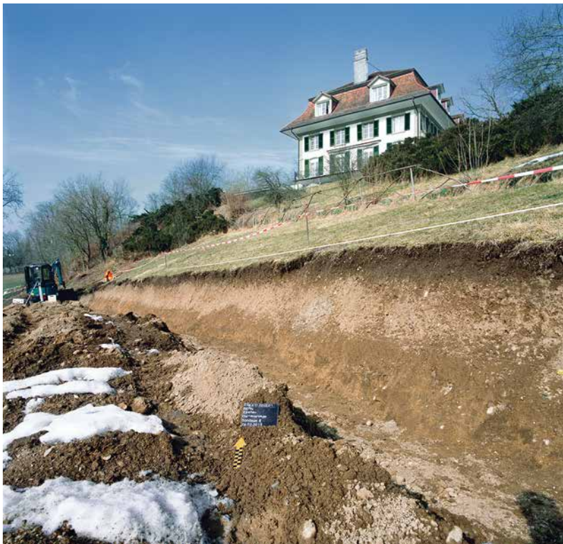
Abb. 1: Bern, Efenau. Sondierschnitt im Hangbereich der Parkanlage von 1814 unterhalb des Herrenhauses aus der Zeit um 1780. Blick nach Norden.

ordens. In der Folge wurde es als herrschaftliches Landgut weiterbetrieben. Wohl unter Gabriel von Wattenwyl (1654–1730) und seinen Nachfolgern entwickelte es sich zu einer der zahlreichen prächtigen Campagnen im Berner Umland. Die ältesten Abbildungen aus dem 17. Jahrhundert zeigen unterhalb des Herrenhauses inmitten einer ausgedehnten Gartenlandschaft verschiedene weitere Gebäude. Um 1780 wurde das Herrenhaus, das «Alte Riegelhaus», wie es hiess, abgebrochen und durch die heutigen Herrschaftsbauten ersetzt.