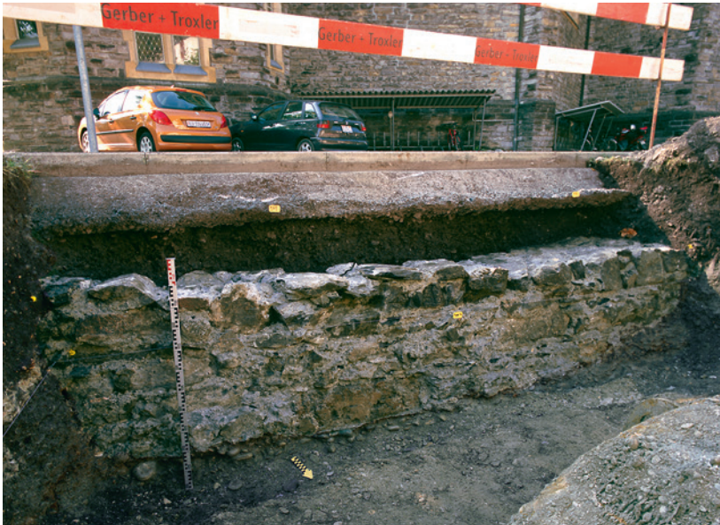
Abb. 3: Interlaken, Schloss. Fundament der Südfassade der Nonnenkirche des 14. Jahrhunderts. Blick nach Süden.

der Kirche einzelne Mauerzüge aufgedeckt, die zusammen mit Mauerfunden, die 1956 beim Bau des sogenannten Beatushauses zum Vorschein kamen, einen grösseren gemauerten Baukomplex von rund 30 mal 30 Metern annehmen lassen (Abb. 2.10). Es ist deshalb davon auszugehen, dass nordseitig der Kirche eine weitere Konventanlage stand, wohl die der Frauen, die ebenso wie diejenige der Männer mit gemauerten Gebäuden um einen Kreuzhof herum ausgestattet war.