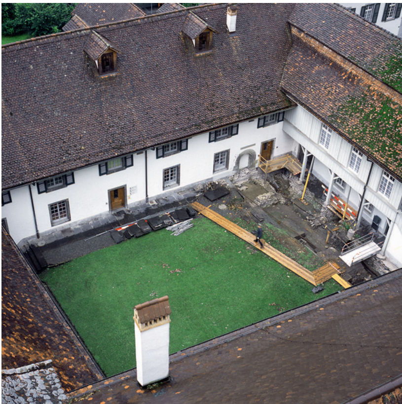
Abb. 1: Interlaken, Schloss. Blick in den spätgotischen Kreuzhof mit der Ausgrabung im Bereich des romanischen Konventflügels West. Im Hintergrund das Corps de Logis des barocken Landvogteischlosses. Blick nach Südwesten.

Das Augustiner-Chorherrenstift Unserer Lieben Frau in Interlaken wurde 1133 erstmals genannt, seit 1247 erscheinen Stiftsdamen in den Schriftquellen. Reiche Schenkungen und Käufe im 13. und 14. Jahrhundert machten das Doppelkloster zu einer der grössten Grundherrschaften im Berner Oberland. Es diente nach seiner Aufhebung im Jahr 1528 als Spital und Landvogteisitz und ist bis heute Regierungsstatthalteramt. Die ehemalige Klosterkirche beherbergt die evangelisch-reformierte Kirchgemeinde. Die Anlage weist heute einen Baubestand auf, der im Wesentlichen auf Um- und Ausbauten seit dem 15. Jahrhundert zurückgeht. Es gab in den letzten Jahrzehnten immer wieder punktuelle Bodeneingriffe und Bauuntersuchungen auf dem Schlossareal. Die archäologischen Untersuchungen der Jahre 2010 bis 2012, die durch umfang-