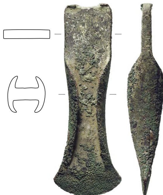
Abb 3: Zweisimmen, Lochgässli 7. Spätbronzezeitliches Lappenbeil vom Typ Tarmassia, Variante Ollon. M. 1:2.