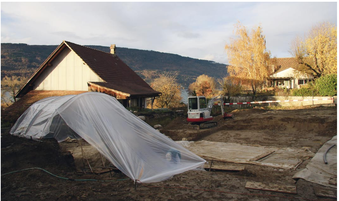
Abb. 1: Sutz-Lattrigen, Seerain. Grabungsfläche mit Bielersee und Jura im Hintergrund. Blick nach Norden.

Bereits im Neolithikum wurde die Strandplatte vor Lattrigen intensiv genutzt. Wir kennen nicht weniger als vier dem heutigen Ufer vorgelagerte Ufersiedlungen, sogenannte Pfahlbauten, aus der Zeit von 3600 bis 2700 v. Chr. Bei der archäologischen Untersuchung des im 16. Jahrhunderts erstmals erwähnten Ländtehauses (Abb. 2, gelber Punkt) konnten 2007 prähistorische Keramikfragmente, eine bronzeitliche Rollnadel und ein vielleicht ebenfalls bronzeitlicher Angelhaken sowie stark verrundete Ziegelfragmente geborgen werden. In den Feldern rund 500 m südlich wurden wiederholt Architekturfragmente und Leistenziegel aufgepflügt, die zu einem römischen Gutshof gehören müssen. All dies weist darauf hin, dass vermutlich bereits in prähistorischer und