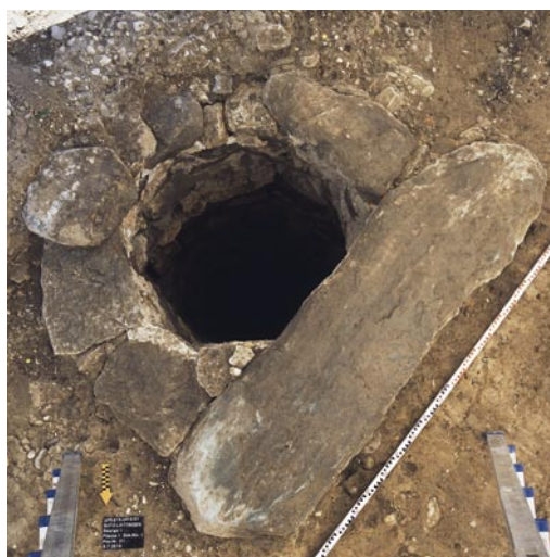
Abb. 3: Sutz-Lattrigen, Seerain. Der Sodbrunnen zum in den 1930er-Jahren abgebrannten Haus war mit einer riesigen Kranzabschlussplatte ausgestattet.

formte Steinkugel, die auf dem Sortiertisch aus dem Schichtmaterial ausgelesen wurden (Abb. 4). Letztere hat einen Durchmesser von 17,4 bis 19,0 mm. Mir ist nur ein Vergleichsstück aus einem mittelbronzezeitlichen Kriegergrab (Bz C) bekannt, welches 2009 in Güttingen (D) ausgegraben wurde. Die Kugel wurde zusammen mit einer Steinbeilklinge als Beigabe in das mit Bronzeschwert und -nadel, goldenen Finger- und Haarringen ausgestattete Grab mitgegeben (freundliche Mitteilung