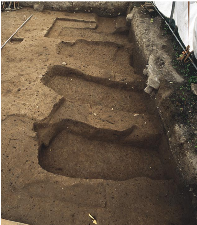
Abb. 5: Sutz-Lattrigen, Seerain. Im Norden der Grabungsfläche sind vier lange, schmale Gruben in die prähistorische Fundschicht eingetieft.

Jürgen Hald, Konstanz). Neben den prähistorischen Scherben, die zum Teil stark verrundet und wahrscheinlich umgelagert sind, konnten einige Fragmente grauer Ware geborgen werden. Im unteren Teil des Schichtpakets war diese hochmittelalterliche Keramik sehr spärlich, in den oberen Bereichen aber auch mit einem Leistenrand vertreten. Zwei weitere Randscherben dieses Typs, der in die zweite Hälfte des 13. Jahrhunderts datiert, stammen aus in die Fundschicht eingetieften Gruben. Vermutlich handelt es sich bei den bronzezeitlichen Funden um umgelagertes Material, das aus einer weiter hangaufwärts liegenden Siedlungsstelle stammt.