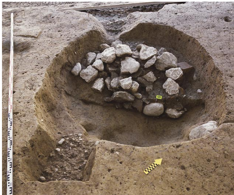
Abb. 7: Sutz-Lattrigen, Seerain. Eine mit (Brand-)Schutt verfüllte Grube gehört wohl zur hochmittelalterlichen Nutzung des Areals. In der vorderen Grubenhälfte ist die Einfüllung bereits vollständig, hinten teilweise abgebaut.