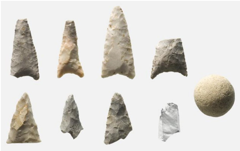
Abb. 4: Sutz-Lattrigen, Seerain. Silexpfeilspitzen, Bergkristall und Steinkugel. M. 1:1.