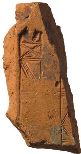
Abb. 6: Sutz-Lattrigen, Seerain. Fragment einer Bodenfliese mit Stempeldekor. M. 1:2.

Andres Moser, Die Kunstdenkmäler des Kantons Bern . Landband III. Der Amtsbezirk Nidau 2. Teil. Die Kunstdenkmäler der Schweiz 106. Bern 2005, 230–232.