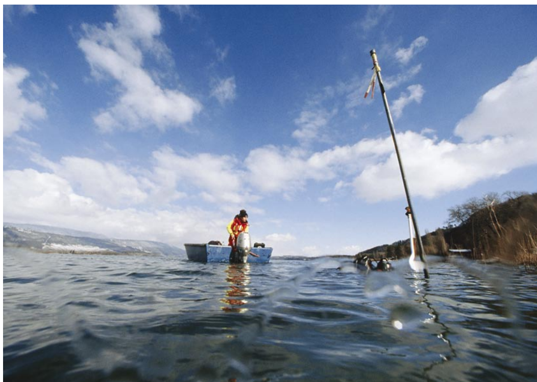
Abb. 1: Vinelz, Underi Budlei. Tauchaktion an der Fundstelle.