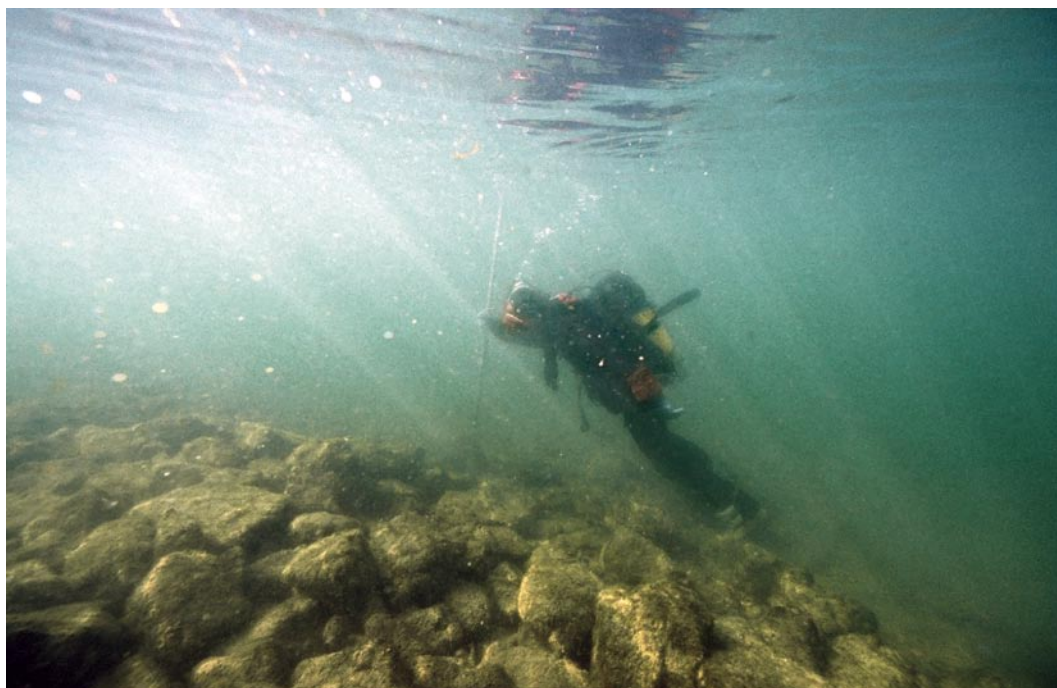
Abb. 3. Vinelz, Underi Budlei. Ansicht des Steindamms aus grossen Blöcken. Die Anlage wurde Ende des 19. Jahrhunderts errichtet.