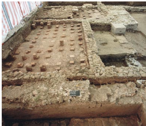
Abb. 6: Kallnach, Hinterfeld, römischer Gutshof. Blick von Osten über die Anlage. Im Vordergrund die Ostmauer (193) mit dem praefurnium zu Raum 4. Der Feuerkanal wurde sekundär eingebaut und nach Aufgabe des Hypokausts wieder zugemauert. In Raum 4 sind über dem verfüllten Hypokaust nur noch Spuren des eingezogenen Mörtelbodens erhalten.

Abb. 5: Kallnach, Hinterfeld, römischer Gutshof. Im Vordergrund Raum 1. Der Unterboden des Hypokausts ist mit Dachziegeln belegt. Rechts die kleine Verbindungsöffnung zur Tubulatur zwischen den Mauern. An der Mauerfront Verputzreste mit Abdrücken von tubuli. Im Mittelgrund das caldarium Raum 2 und die porticus Raum 3 mit einer der beiden Säulenbasen. Im Hintergrund das frigidarium Raum 4 mit vorgebautem Erker. Blick nach Osten.