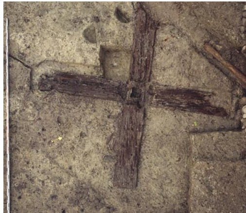
Abb. 2: Kallnach, Hinterfeld, römischer Gutshof. Das Holzkreuz aus zwei verbläteten Balken mit zentraler, quadratischer Öffnung zum Einsetzen eines Ständers. Leider erbrachte die dendrochronologische Datierung kein sicheres Ergebnis.

Als südlichen Hof bezeichnen wir hier die von Mauern umfasste, nicht direkt an das Gebäude anschliessende Fläche (A). Bisher kennen wir davon weder die gesamte Ausdehnung noch den genauen Grundriss. Als Teile der Begrenzung sehen wir die Mauern (83), (63) und (131). Mauer (63) bildet nur in der Westhälfte von (A) die nördliche Begrenzung. Mauer (131) läuft nordwärts über diese Flucht hinaus und könnte mit Mauer (192) einen Abschluss bilden. Benutzungsniveaus mit Spuren einer Garten- oder Parkgestaltung waren im Hof (A) nicht erhalten. Die Hoffläche wird von einem Mauerausbruchgraben (128) und verschiedenen Drainagegräben durchzogen, die vor dem Bau der Hofmauern angelegt worden sind. Dicht vor der Mauer (63) war ein Kreuz aus Tannenholz (85) horizontal in die Bauplanie eingetieft (Abb. 2). Es dürfte sich um den Fuss einer Bauinstallation, zum Beispiel eines Baugerüsts, einer Hebevorrichtung oder gar eines Vermessungsgerätes handeln.