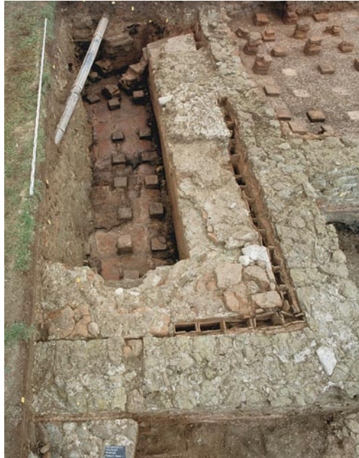
Abb. 5: Kallnach, Hinterfeld, römischer Gutshof. Im Vordergrund Raum 1. Der Unterboden des Hypokausts ist mit Dachziegeln belegt. Rechts die kleine Verbindungsöffnung zur Tubulatur zwischen den Mauern. An der Mauerfront Verputzreste mit Abdrücken von tubuli. Im Mittelgrund das caldarium Raum 2 und die porticus Raum 3 mit einer der beiden Säulenbasen. Im Hintergrund das frigidarium Raum 4 mit vorgebautem Erker. Blick nach Osten.

Abb. 4: Kallnach, Hinterfeld, römischer Gutshof. Raum 1 mit Resten der Hypokaustpfeiler, Beckenmauer und – als Trennung zur Gebäudemauer – Partien mit Tubulatur. Im Hintergrund der schräg in den Hypokaust ziehende Heizungskanal. Blick nach Norden.