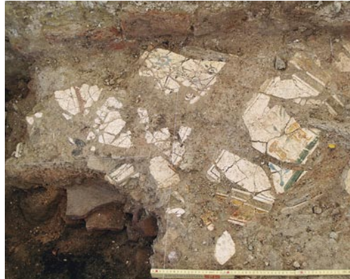
Abb. 7: Kallnach, Hinterfeld, römischer Gutshof. Bemalter Verputz in Fundlage. Er stammt vermutlich von der Decke der porticus (3).

Auf dem untersuchten Areal fanden sich drei gemauerte Kanäle, die das Abwasser aus dem Badetrakt und aus anderen Teilen der Villa abführten (vgl. Abb. 3). Ihre Wände waren teils mit Terrazzomörtel verputzt, die Sohlen mit Hypokaust- oder Dachziegeln belegt. Der grösste Kanal hatte eine lichte Weite von 60 × 100 cm. Kanal (264) führte leicht schräg, dicht ausserhalb von Raum 4 vorbei (Abb. 8) und mündete etwa 10 m südlich der Gebäudefront in den Ost-West verlaufenden Kanal (342). Die Anbauten an der Aussenfront von Mauer (193) sowie die Hofmauern entstanden nach dem Kanalbau. Den Ansatz eines weiteren, nur einige Zentimeter tiefen Kanals (287) haben wir an der Südwestecke von Raum 3 erfasst. Eine dicht an der westlichen Grabungsgrenze in Kanal (342) mündende Rinne (372) dürfte das Endstück von (287) sein. Nebst Dachwasser könnte (287) auch das Abwasser