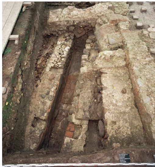
Abb. 8: Kallnach, Hinterfeld, römischer Gutshof. Der Kanal (264), ausgekleidet mit Terrazzomörtel und Hypokaustplatten. In den Kronen der Kanalwände Aussparungen für die Abdeckung. Das Podest im Vordergrund rechts könnte als Zugang zu (nicht nachgewiesenen) WC-Anlagen gedient haben, die über den angrenzenden Kanal gebaut waren. Im Hintergrund das praefurnium (243) zu Raum 4. Blick nach Süden.

der piscina 1 aufgenommen haben. Wenig vor der Gebäudefront führte eine Traufrinne (345) das Dachwasser in den Kanal (264).