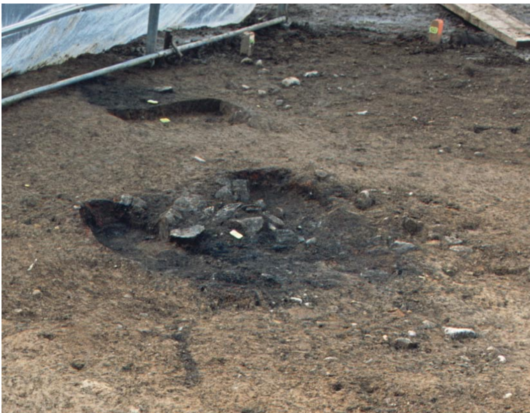
Abb. 3: Allmendingen, Kie- nerrmätteli. Im Vordergrund die Brandgrube 1 mit verzie- gelten Wänden und Teilen der Einfüllung aus Holzkohle und verbrannten Steinen. Hinten die Aschegrube, ein Teil der Einfüllung ist bereits abgebaut. Blick nach Westen.