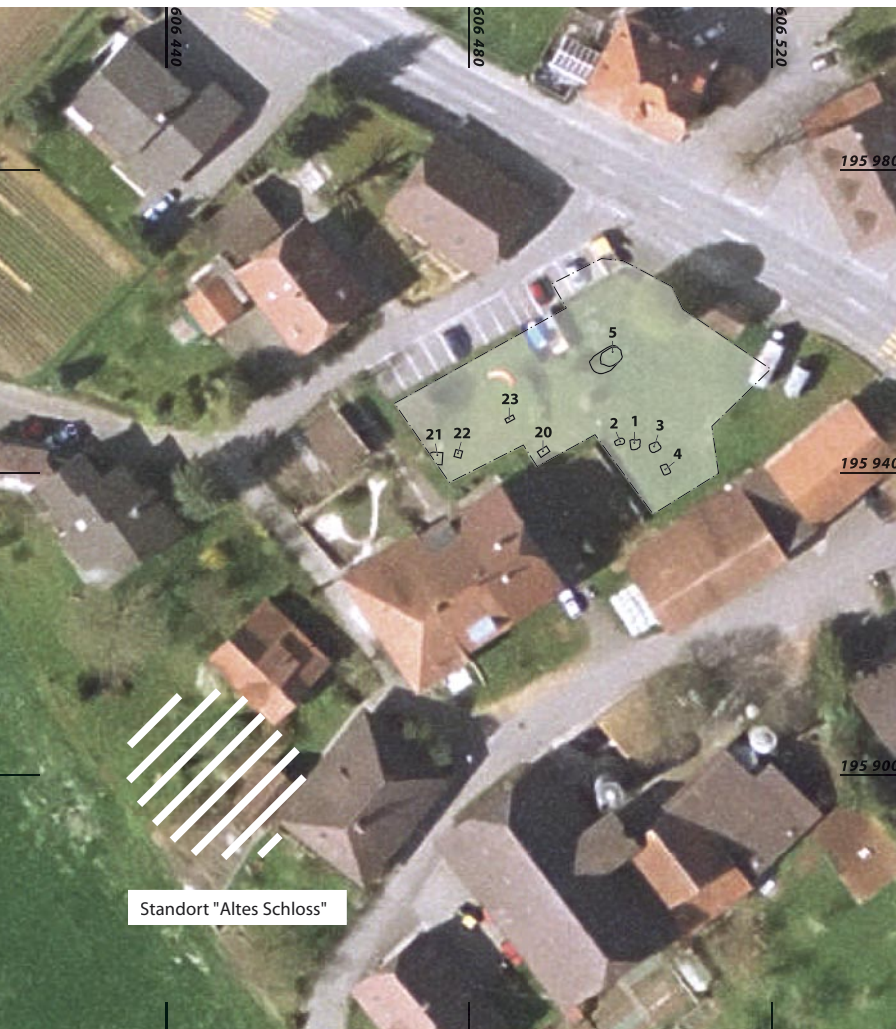
Abb. 1: Allmendingen, Kienermätteli. Untersuchungsfläche mit den Gruben 1 bis 5 und 20 bis 23. M. 1:1000.

In der untersuchten Fläche konnten 9 Gruben dokumentiert werden (Abb. 1). Die vier westlichen Strukturen 20–23 lieferten Keramik und Kleinfunde des 18. bis 20. Jahrhunderts (Abb. 2) und gehören zu neuzeitlichen Bauernhöfen. Von den vier östlichen Gruben sind vor allem zwei erwähnenswert. Die quadratische Brandgrube 1 mit einer Seitenlänge von 1,35 m war noch 20 cm tief erhalten und wies stark verbrannte, verziegelte Seitenwände und eine brandgerötete Sohle auf. Die Einfüllung enthielt viel Holzkohle und verbrannte, hitzegesprengte Geröllsteine (Abb. 3). Es muss sich hier um eine Feuerstelle oder Ofenkonstruktion handeln.