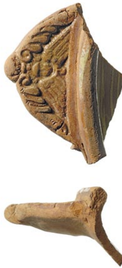
Abb. 2: Allmendingen, Kie- nerrmätteli. Randscherbe mit gemodeltem Griffappen aus dem 18. Jahrhundert. M. 1:2.

Flechtzäunen säumen die beiden Längsseiten der Grube. An der westlichen Schmalseite konnten im Abstand von 0,2 m beidseits des Firstpfostens ebenfalls zwei kleine Pfostenlöcher beobachtet werden. Im Osten liegen die Enden der beiden Konstruktionen direkt übereinander, so dass die Zugehörigkeit der Löcher nicht eindeutig zu klären ist. Hüttenlehmfragmente in der Einfüllung könnten vom Lehmverstrich