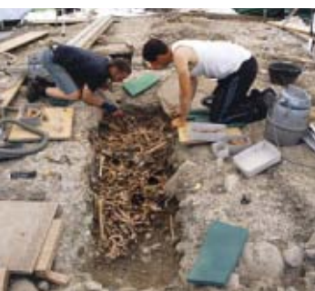
13 Bern, Schönberg Ost