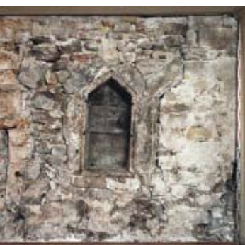
47 La Neuveville, Rue du Collège 10