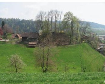
78 Sumiswald, Burgbüel