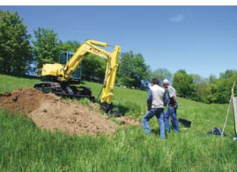
15 Bern, Engehalsinsel