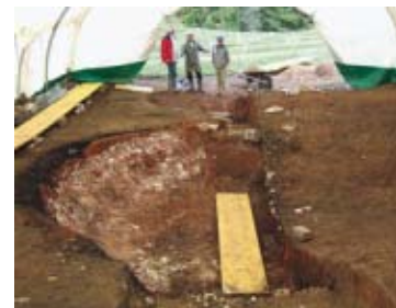
73 Sorvilier, La Rosière