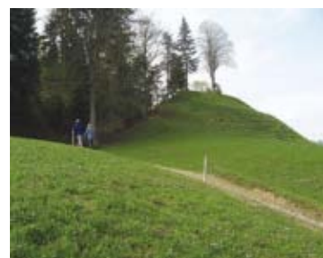
58 Lützelflüh, Schmidsleen