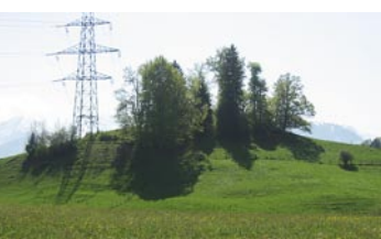
98 Wimmis, Mösli/Galgenhubel