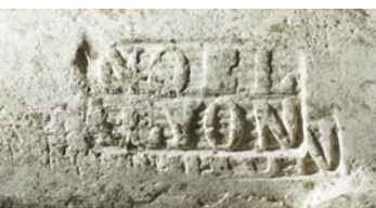
32 Ins, Im Lüschech