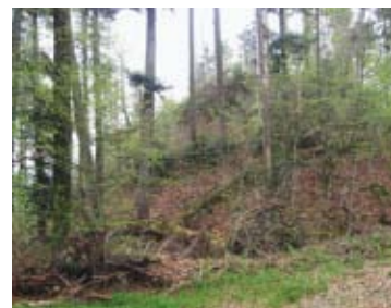
56 Lützelflüh, Münneberg