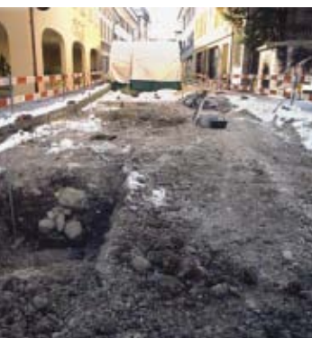
62 Moutier, Vieille Ville