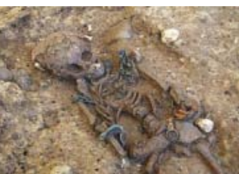
34 Ipsach, Räberain