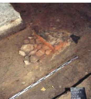
64 Niederbipp, Kirchgasse 8