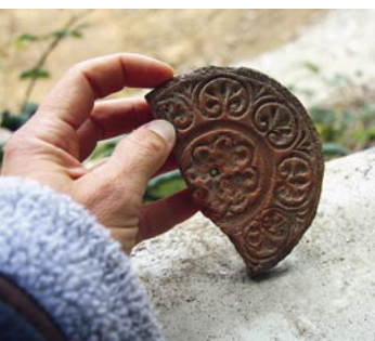
49 Langenthal, Wuhrplatz