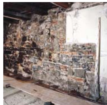
9 Bern, Gerechtigkeitsgasse 7