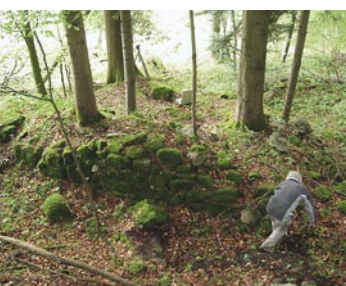
97 Wimmis, Gatafel/Gatafelgraben