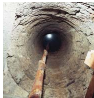
93 Utzenstorf, Schloss Landshut