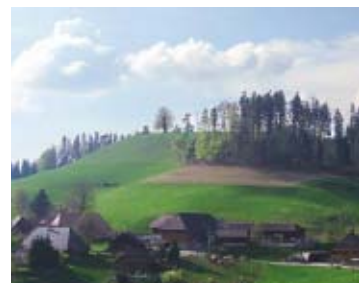
1 Affoltern i. E., Lueg