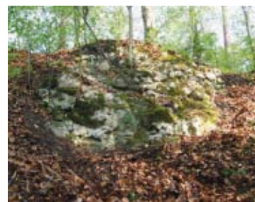
57 Lützelflüh, Ruine Brandis