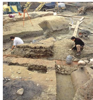
37 Kallnach, Hinterfeld