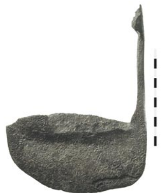
22 Burgdorf, Mühlegasse