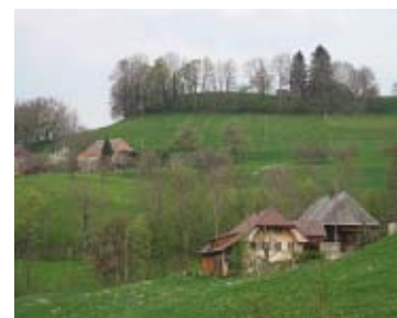
23 Eriswil, Guggli