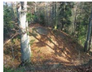
77 Sumiswald, Bärhegechnübeli