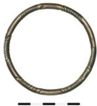
43 Köniz, Nähe Kirche