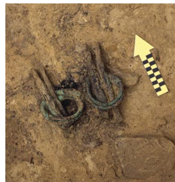
40 Köniz, Buchsi