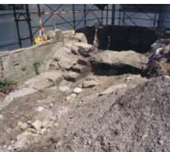
11 Bern, Langmauerweg 110