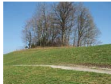
87 Trachselwald, Fälbe/Schloss-Chnubel