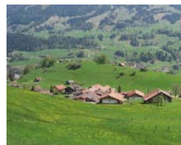
25 Erlenbach i.S., I der Litz / Uf Windweeje