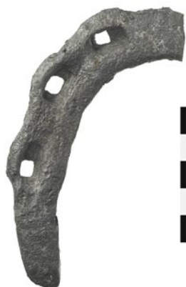
95 Walkringen, Bigenthal/Obermadwald