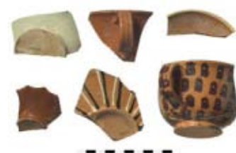
89 Unterseen, Auf dem Graben 11