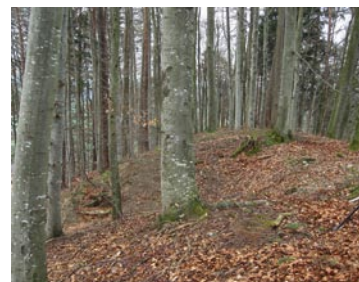
90 Ursenbach, Schynegütsch