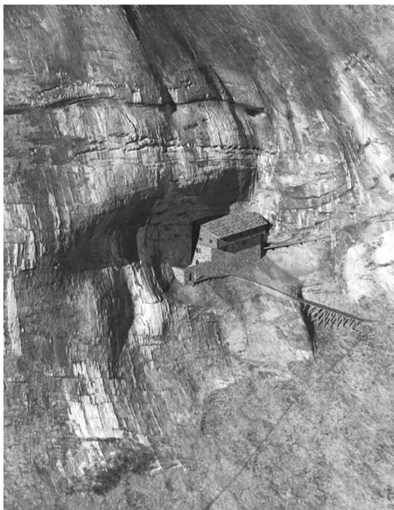
Mögliche Gestalt der Balmburg im 13. Jahrhundert. Ansicht von Nordosten. Possible appearance of the cave castle in the 13 th century. View from the northeast.

Einziges mit Mauerresten erhaltene Balmberg des Kantons Bern. Namengebend dürfte das breite rostrote Band (Eisenoolith) in der sechzig Meter hohen Felswand über der Burg sein. Spuren des Erzabbaus finden sich an mehreren Stellen der Tschingelfluh.