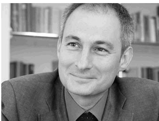
Бернхард Пульвер, министр образования

Моей центральной задачей является создание условий, обеспечивающих комфортное пребывание детей в школе и их хорошие взаимоотношения с преподавателями, а также доверие со стороны родителей. Надёжное, ориентированное на будущее партнёрство между школой и родителями является хорошей основой для успешного развития детей в школе. Я считаю крайне важным налаженное взаимодействие в этом вопросе.