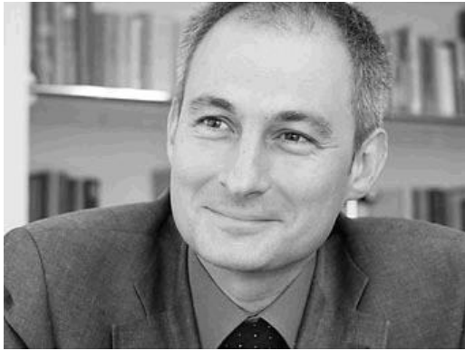
Bernhard Pulver, Direttore cantonale della pubblica istruzione

nel corso dei primi anni di formazione, la scuola e la scuola dell'infanzia ricoprono una posizione molto importante nella vita dei bambini. A questa età essi scoprono un mondo affascinante, nel quale i rapporti con i loro compagni di classe hanno un ruolo molto significativo.